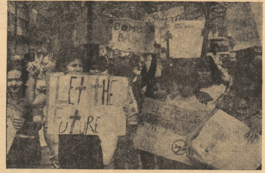
„Dorim să trăim în liniște și pace”, spun acești copii din New York participanți la o mare demonstrație pentru dezarmare

TOKIO 5 (Agerpres) — Joi, în ajunul marilor manifestări în memoria celor 200.000 victime ale bombardamentului atomic de la 6 august 1945, la Hiroshima a avut loc un mare miting împotriva armelor nucleare, informează agenția U.P.I. Cei peste 3.000 de participanți la această acțiune au străbătut Bulevardul Păcii, trecînd pe lângă Parcul Păcii, ridicînd ca memorial și avertisment adresate omenirii pentru ca asemenea tragedii să nu se mai repete.