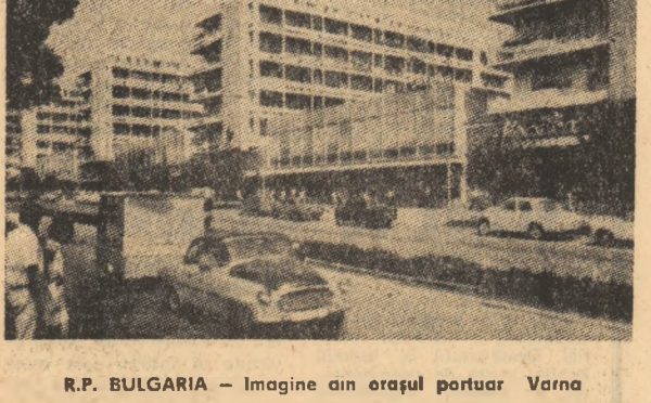
R.P. BULGARIA — Imagine din orașul portuar Varna

„Jeune Afrique“: O viață de calvar În Italia, prezența masivă a oamenilor de culoare — „gente di color” — este un fenomen recent. Întocmind un inventar al muncitorilor veniți din țările „lumii a treia”, mai ales din Africa, în căutarea unei vieți mai prospere, revista „Jeune Afrique” arată: „În marile orașe italiene, Milano, Neapole și Torino erau 1.000 în 1960, 10.000 în 1970, între 700.000 și 800.000 în 1982. În Mezzogiorno, regiunea agricolă a sudului, mii de sezonieri maghrebi și sud-sahariani sînt folosiți la muncile cîmpului. Într-înălț în Italia cel mai adesea clandestin, acești căutătorii ai unui trai mai bun efectuează, «la negru», muncile pe care italienii consideră degradate pentru ei”. Mai mult încă, observă cu malicie revista la care ne referim, italienii dau dovadă de unorat atunci cînd scriu, pe cărțile de muncă eliberate unui număr de 270.000 de emigranți, «tehnician sanitar» în loc de «gunoier”.