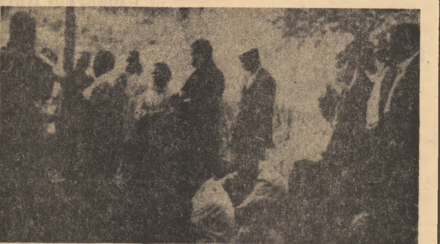
„Jeune Afrique“: O viață de calvar

epicentrul la 20 de kilometri nord-vest de Atena, nu a provocat victime și nici pagube materiale. ● SENATUL AMERICAN a adoptat un amendament la Constituția S.U.A., sprijinit de președintele Ronald Reagan, în baza căruia Congresul ar urma să fie obligat să voteze în fiecare an un buget echilibrat — relatează agenția France Presse. Potrivit amendamentului, excepții de la această regulă ar urma să fie admise numai în situații de război sau în cazul cînd alți membrii Camerei Reprezentanților, cit și senatorii se pronunță, cu o majoritate de cel puțin trei cîinci, pentru adoptarea unui buget deficitar. ● ASA-NUMITUL „SINDROM TOXIC”, provocat de consumul de ulei alterat, a cîntărit obitua trecuții să facă victime în Spania. După cum s-a anunțat la Madrid, din surse oficiale, în iulie au fost înregistrate trei noi decese datorate aceste marelui fapt care a făcut să urcă la 327 numărul celor pe care „Sindromul toxic” i-a răpus din viață în 1981.