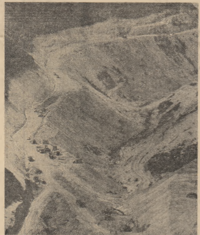
În pagina a 3-a: „Sciteia tineretului” pe traseele romantismului revoluționar CA UN CLOPET DE ARAMĂ RĂȘUNĂ APUSENII LA ROȘIA POIENI