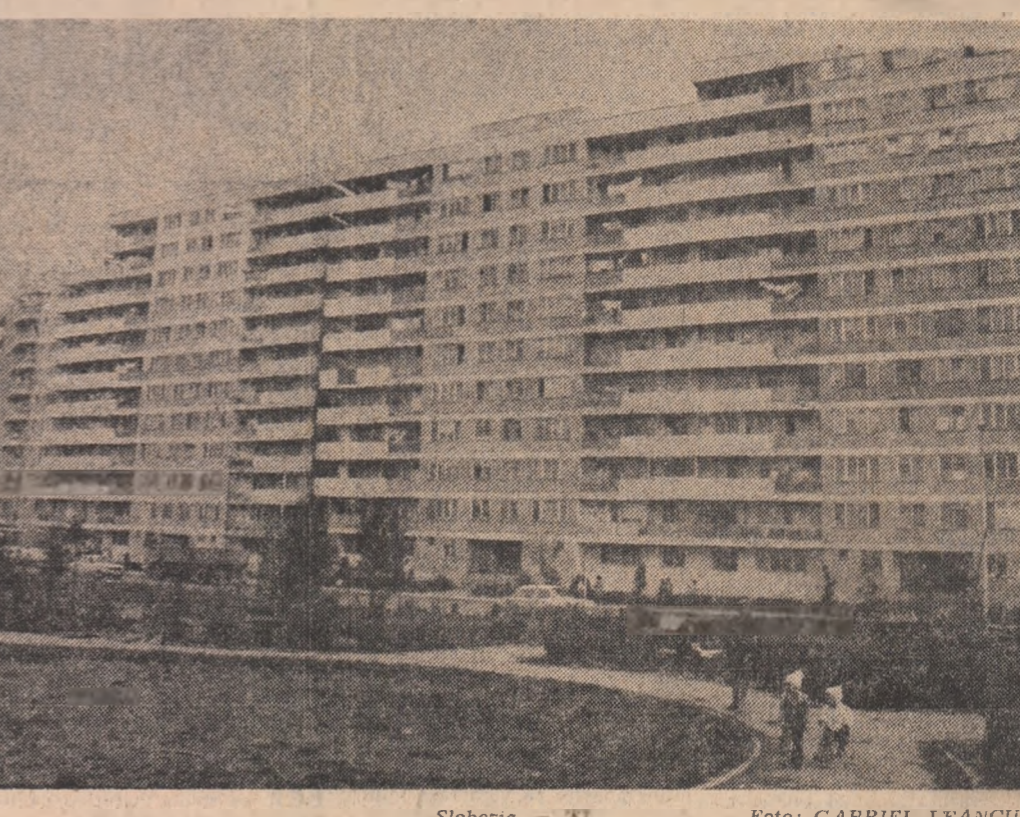
Slobozia — '83