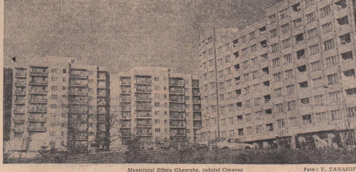
Municipiul Sfintu Gheorghe, județul Covasna