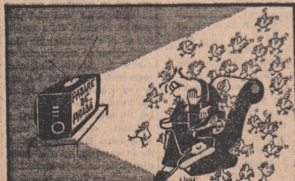
Un nou serial de televiziune: „Paștre de prădă”