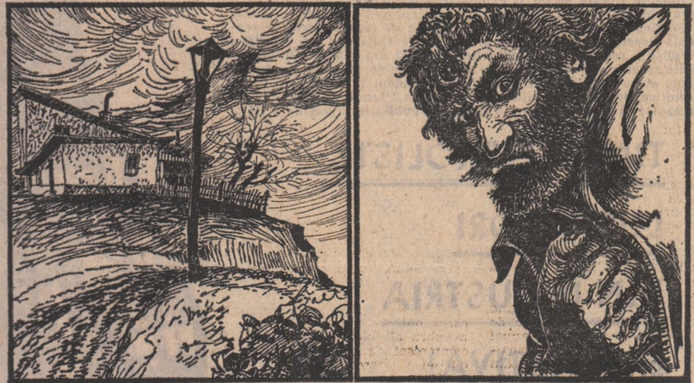
Două dintre propunerile pentru copertă. Eugen Barbu a preferat o a treia