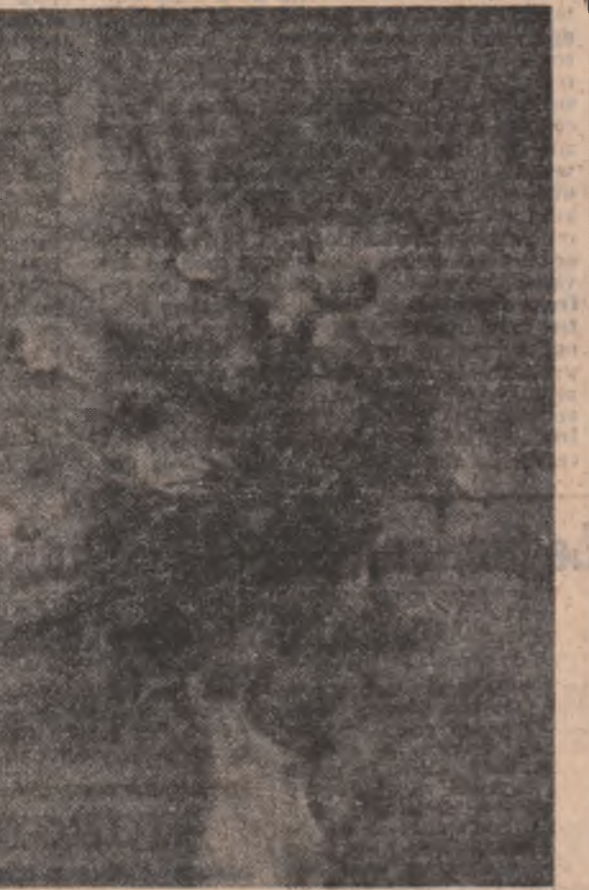
Un tablou pe săptămîna