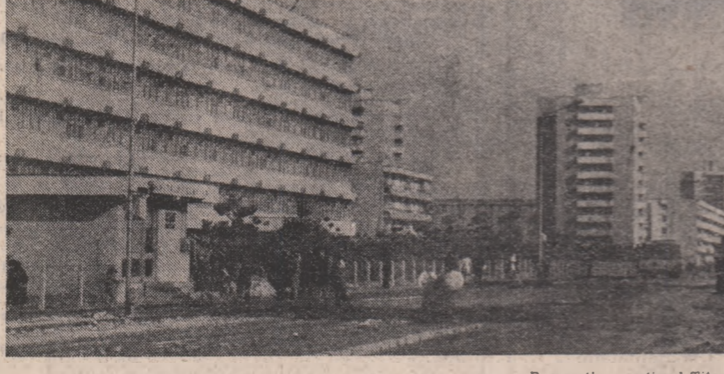
București — cartierul Titan

● În perioada scursă din acest an, celelalte de oameni ai muncii din unitățile industriale ale județului Mureș au realizat și livrat suflănterul economic național important cantități de produse. Constructorii de mașini din Tg. Mureș, Tîrnăveni și Sighisoara, de