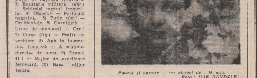
Pistru și narcise — un zimbet de... 16 mm.