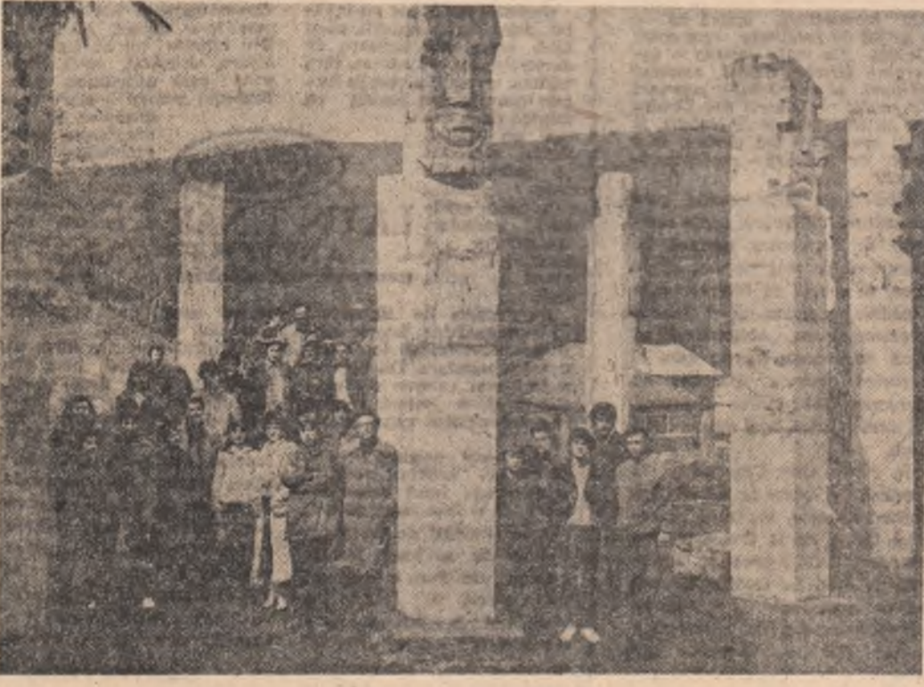
O clipă de reculegere la Monumentul Eroilor de la Moiseș