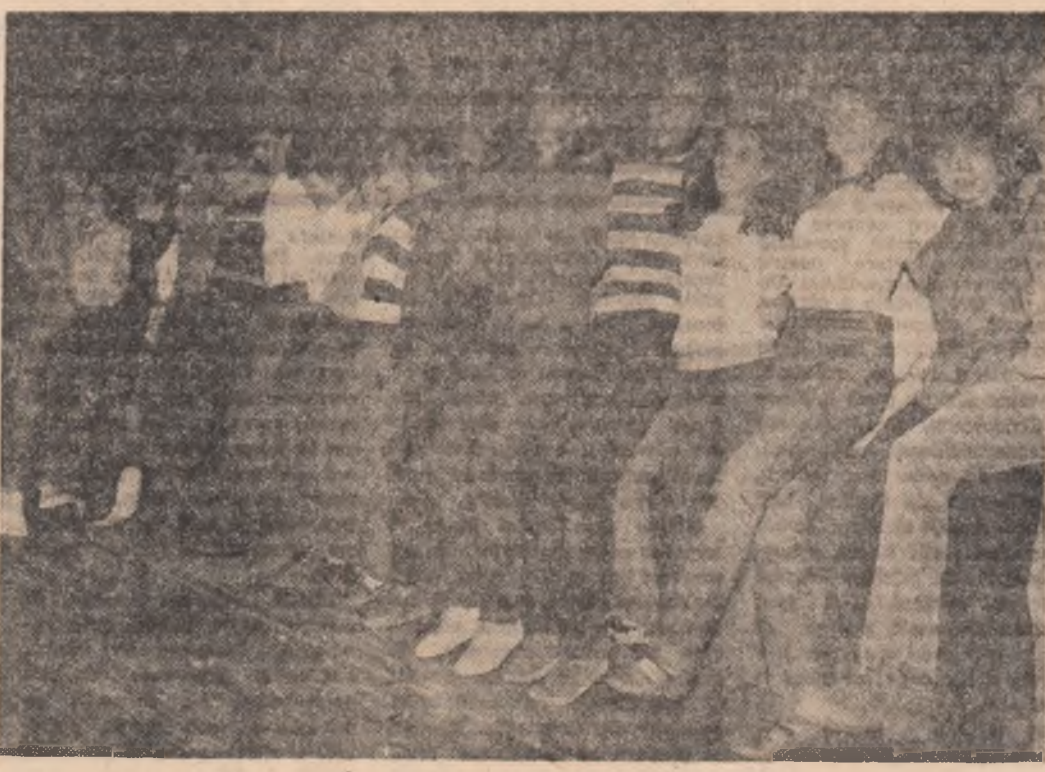
Și din nou tînerețea și exuberanța săliilor de spectacol