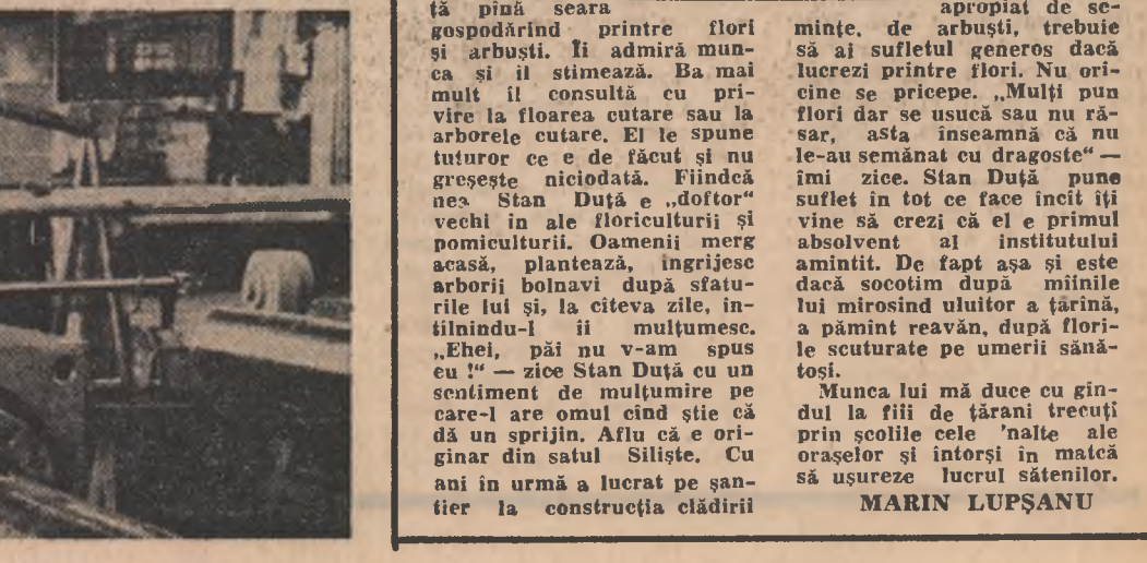
Realizări semnificative se înregistrează și pe linia creșterii