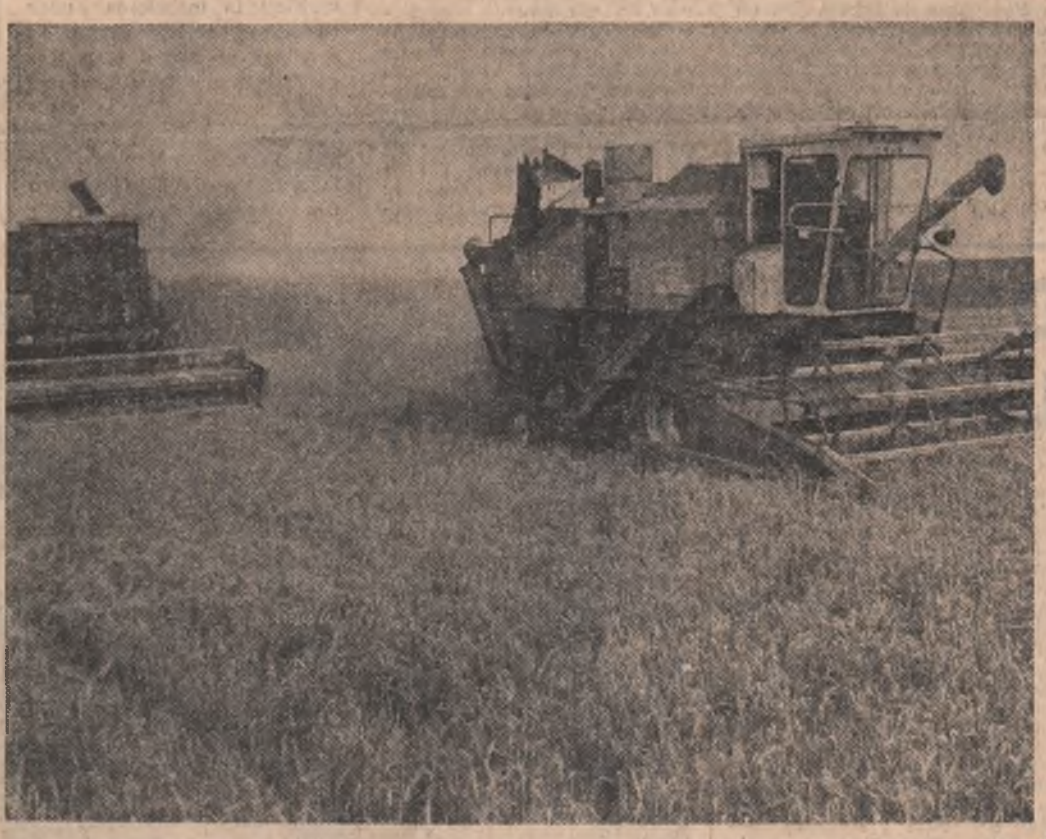
Realizări semnificative se înregistrează și pe linia creșterii