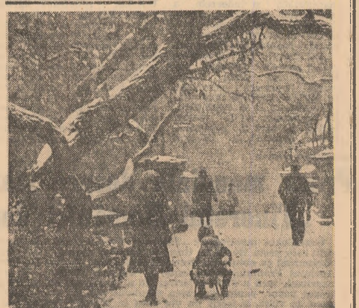
E iarnă, iar...