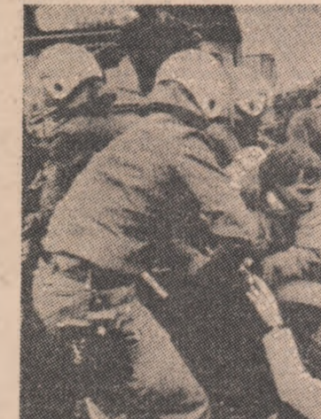
Numeroși tineri vest-germani au protestat în fața depozitului militar Mamlagen, care adăpostește armament nuclear, împotriva prezenței rachetelor Pershing II pe teritoriul țării lor.

Un acord pentru construirea unui cablu submarin de telecomunicații, din fibră optică, care va lega Franța, Marea Britanie și Statele Unite, a fost semnat la Eastbourne (Anglia), a anunțat compania națională de telecomunicații, „Telecom”. Construirea cablului, lung de 6.657 kilometri, va costa 335 milioane dolari. El va putea transmite simultan aproape 8.000 comunicații, și va inaugura să va avea loc în 1988. Acordul urmează să fie definitivat în iunie a.c.