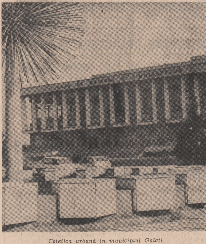
Estetica urbană în municipiul Galați