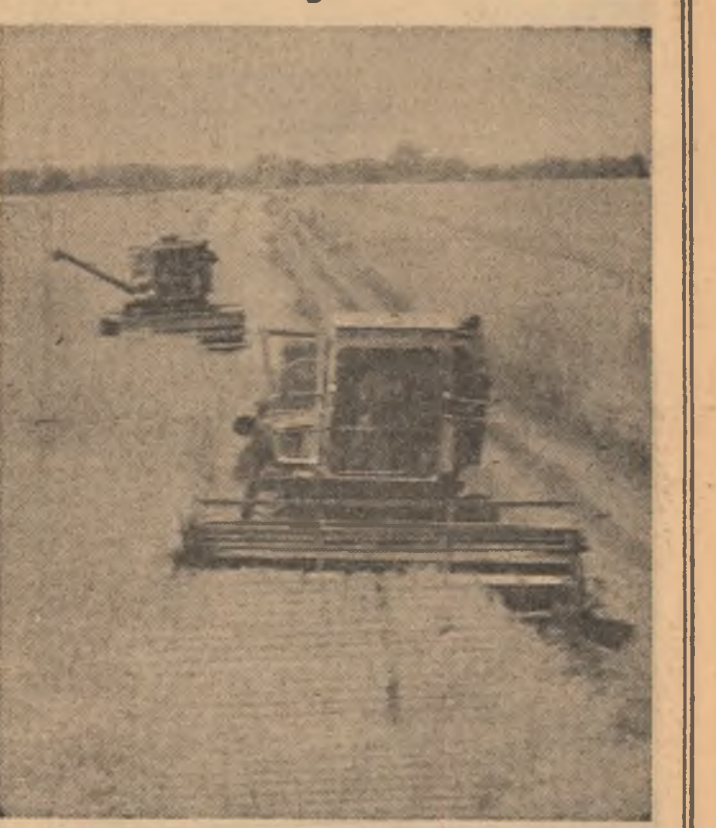
Pagina a 2-a: