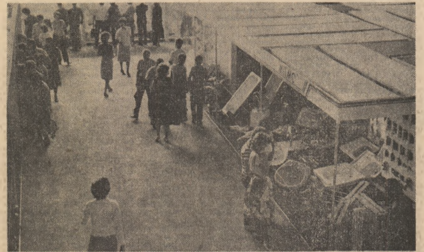
Relatări în pagina a 3-a