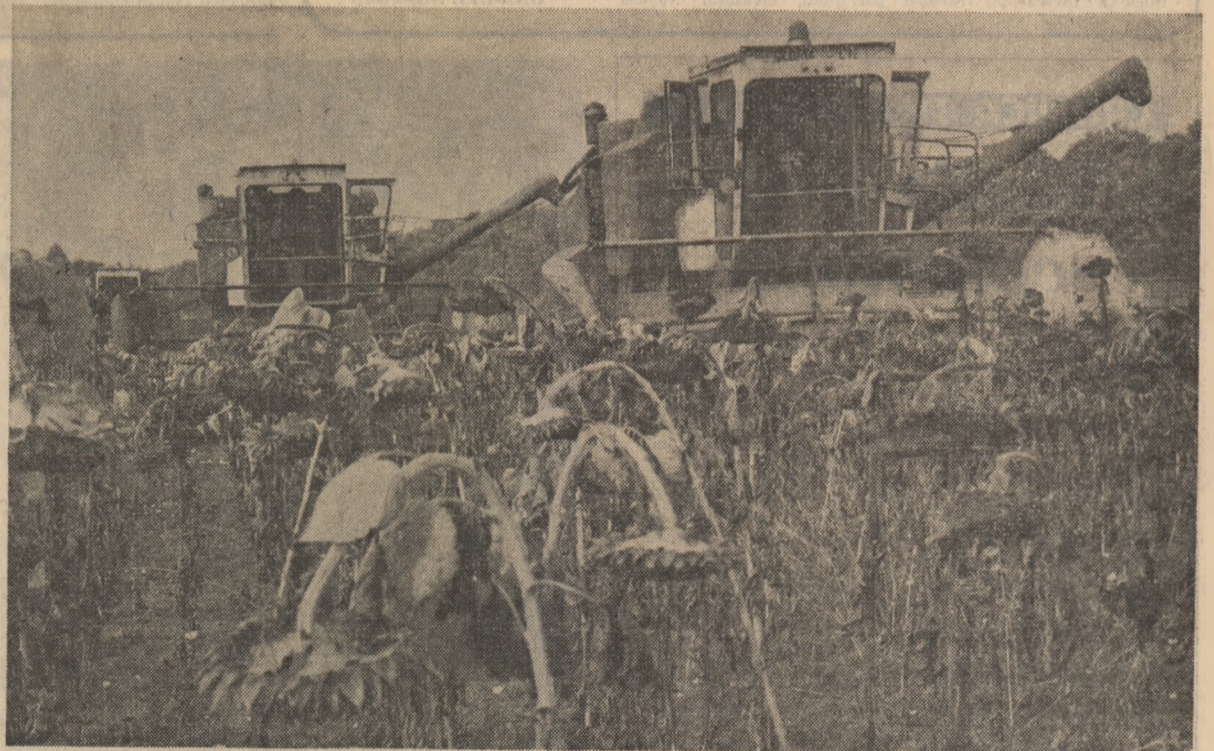
Relatări din județele BUZĂU, SATU MARE și GALAȚI în pagina a 3-a

● În mai multe județe ale țării au început recoltările din campania de toamnă, combinele fiind prezente în lanurile de floarea-soarelui ● Maximă atenție pentru stringerea grabnică și fără pierderi a întregii producții ● Imediat după recoltări, eliberarea cu operativitate a terenurilor și efectuarea arăturilor, în vederea însămințării la cerealele păioase ● Respectarea strictă a tehnologiilor — o condiție de bază în obținerea recoltelor mari și eficiente ● Pe ogoare, acționează în această perioadă un număr mare de tineri, prezenți la toate lucrările de sezon ● Recoltarea și depozitarea porumbului — o acțiune care trebuie pregătită temeinic și desfășurată cu maximă responsabilitate ● În zootehnie, ample acțiuni pentru pregătirea iernării animalelor și punerea la adăpost a unor cantități cit mai mari de furaje