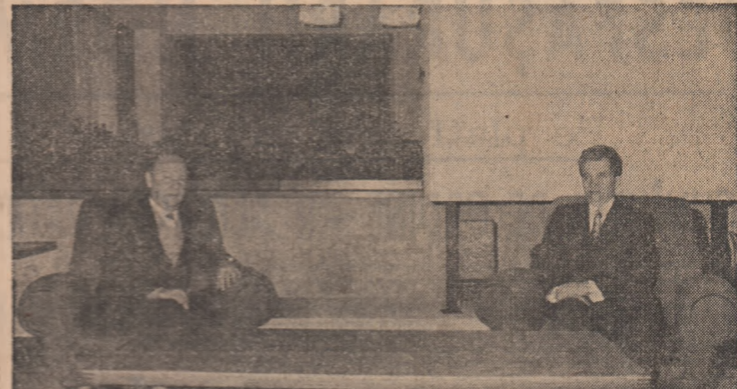
Tovarășul Nicolae Ceaușescu, secretar general al Partidului Comunist Român, prezintă Republicii Socialiste România, a primit, marți, în stațiunea Predeal, pe tovarășul Péter Várkonyi, ministrul afacerilor externe al Republicii Populare Ungare, care a făcut o vizită oficială în țara noastră. Expresînd vii mulțumiri pentru întreprinderea acordată, tovarășul Ceaușescu a transmis tovarășului Várkonyi, ministrul afacerilor externe al Republicii Populare Ungare, care a făcut o vizită oficială în țara noastră. Expresînd vii mulțumiri pentru întreprinderea acordată, tovarășul Ceaușescu a transmis tovarășului Várkonyi, ministrul afacerilor externe al Republicii Populare Ungare, care a făcut o vizită oficială în țara noastră. (Continuare în pag. 6 III-a)

Tovarășul PÉTER VÁRKONYI, ministrul afacerilor externe al R. P. Ungare