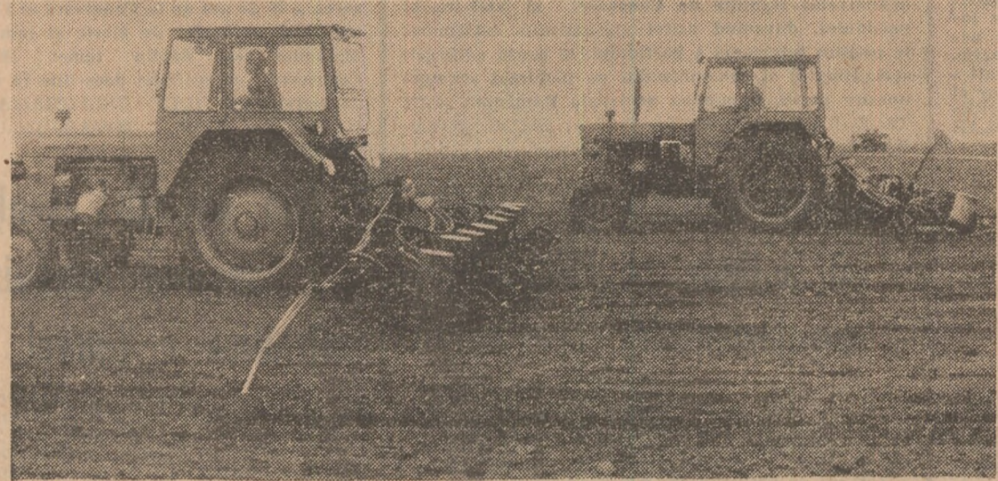
CAMPANIA AGRICOLĂ DE PRIMĂVARĂ — SUB SEMNUL EXIGENȚEI ȘI RESPONSABILITĂȚII (Relatări în pagina a 4-a)

Au anunțat, de asemenea, încheierea însămînțării porumbului pentru consum, a flori-soarelui, soiei, fasolei în ogor propriu, a plantelor pentru nutreți, ca și a altor culturi de primăvară și lucrătorii ogoarelor din Sectorul agricol Ilfov.