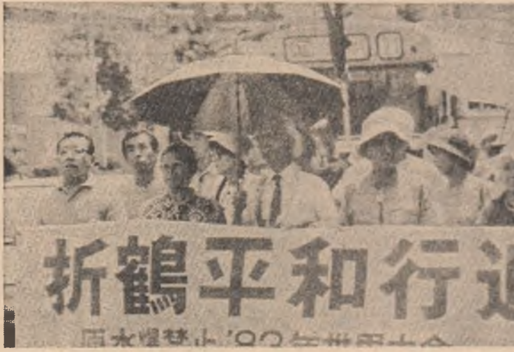
„Declarația păcii de la Nagasaki”