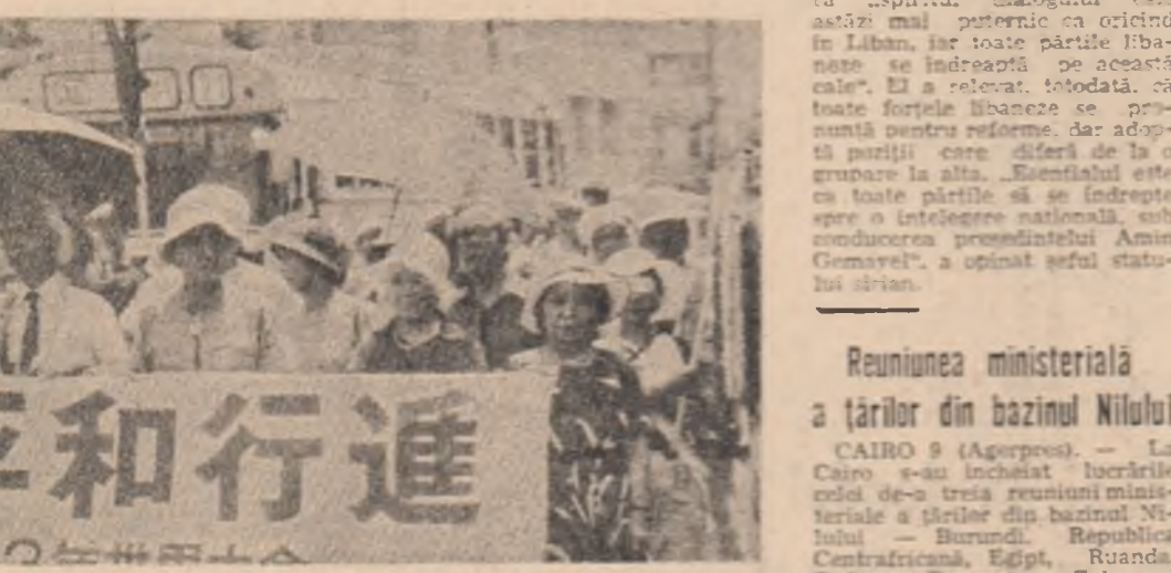
Reuniunea ministerială a țărilor din bazinul Nilului