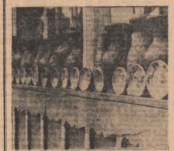
Marginea — un paradis al oarilor