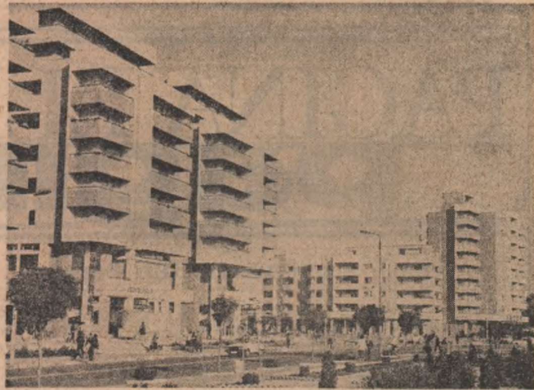
Roșiori de Vede