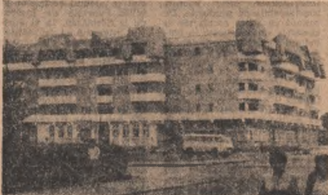
Construcții noi, moderne în zona Tratan din municipiul Tg. Jiu.

Numărul tinerilor pasionați de progres tehnic de introducere în sfera producției a acestuia se ridică în întreprinderea noastră la peste 300.