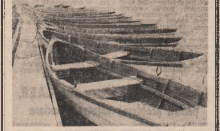
Odihnă la mal.