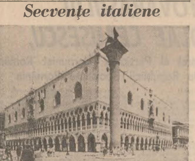
Insemnări din Italia