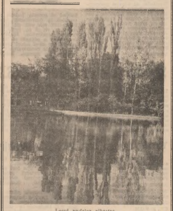
Locul undelor albastre...