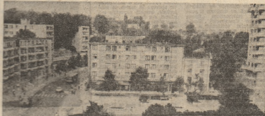
Imagine din Tulcea