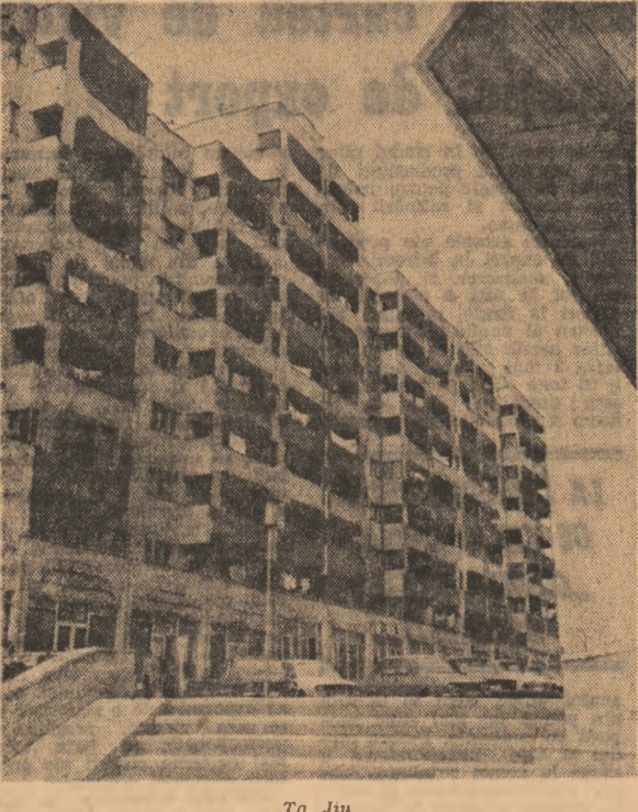
Tg. Jiu