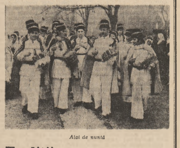
Alai de nuntă