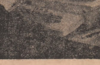
R.P. CHINEZĂ: Introducerea tehnicilor de calcul la Asociația economică cooperatistă din satul „Familia Liu”

Plenara a hotărît convocarea Congresului al XII-lea al partidului în anul 1987.