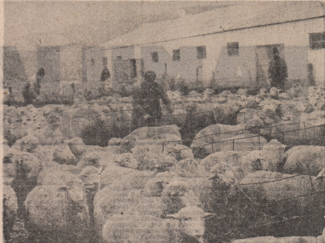
REPERELE ACTUALITĂȚII AGRICOLE

am văzut, a dezbaterii pro-blemelor organizatorice deo-sebite care se ivesc în activi-tățile de zi cu zi. Aceste pro-bleme sînt abordate în ședin-tele de birou, în convorbirile directe cu utesișii și, greșite, în cadrul larg, dinamic, al a-dunărilor generale ale utesișilor. Nu lipsesc din activita-tea comitetului comunal, a bi-rorurilor organizațiilor U.T.C. nici inițiativele privind acțiunile în domeniul educației, for-mării pentru muncă și viață a tinerilor fete. Menționăm aici dialogurile pe teme juridice, pe teme medicale și demogra-fice, pe teme de familie și con-ducerea în muncă și viață. A fost organizat și un schimb de experiență cu organizația U.T.C. din Intreprinderea de confecții Călărăși. Un început, mai exact spus un argument pentru diversificarea activită-ții acestei organizații U.T.C. cu o serie întreagă de rezul-tate bune l-ar putea constitui și reușitele din domeniul activității cultural-educative: organizarea unei brigăzi artis-tice la „Crinul”, corul și echi-pa de dansuri de la nivelul comunei, grupul vocal și chiar serile cultural-distractive or-ganizate, atunci cînd nu sînt campanii, de două sau trei ori pe săptămîină.