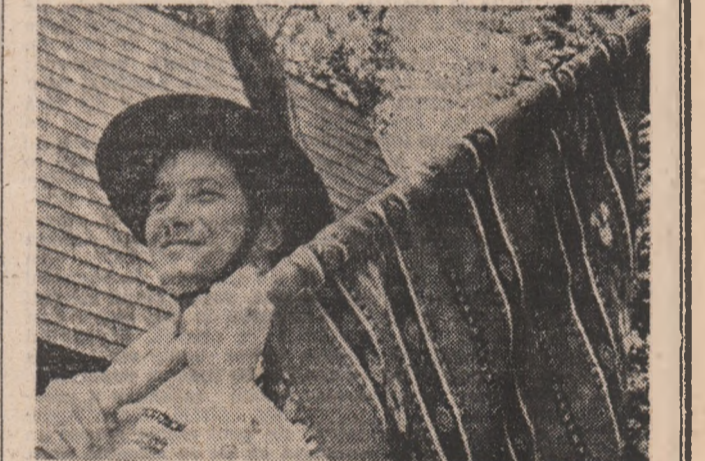
Mindru-i jocul românesc