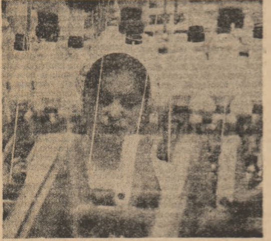
Ce inițiativă vă definește?