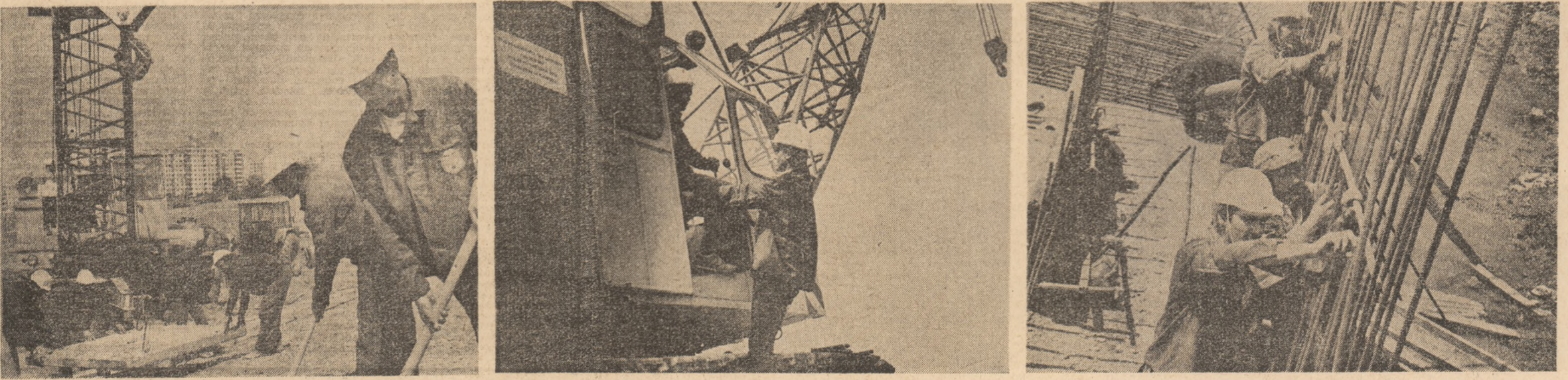
Pagină realizată de MONICA ZVIRJINȘCHI și FLORENȚA MARDALE