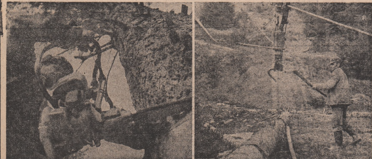
O meserie grea? Fără îndoială, dar mai mult decât asta contează frumusețea ei și satisfacțiile deosebite, mai ales atunci cînd te poți mîndri cu rezultate remarcabile în îndeplinirea planului, așa cum e cazul forestierilor din cadrul U.F.E.T. Poiana Teiului, Județul Neamț.