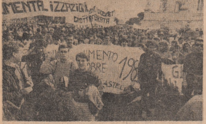
ITALIA: Aspect din timpul unui marș de protest împotriva curselor aberante a inarmărilor, desfășurat la Roma

STOCKHOLM 27 (Agerpres). — Cel puțin șase persoane au fost rănite în noaptea de marți spre