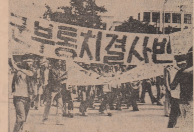
În pofida măsurilor repressive luate de autoritățile sud-coreene pentru a „coimă” nemulțumirea populară, la Seul continuă demonstrațiile de protest. În imagine, aspect din timpul unei manifestații a studenților din Seul

Nigeria este atașată în mod ferm idealurilor și obiectivelor fundamentale fixate în statutul Organizației Unității Africane — a declarat ministrul de externe nigerian, Bola Akinyemi, ca pe prilejul „Zilei Africii”. El a reafirmat poziția guvernului său de sprijin pentru lupta în vederea abolirii apartheidului în R.S.A. și obținerii independenței Namibiei. Referindu-se la ultimele evoluții din sudul Africii, Bola Akinyemi a arătat că rezultatele „alegerilor” pentru parlamentul alb din Africa de Sud scot în evidență faptul că Pretoria practică în continuare politica rasistă. În timp ce majoritatea populației, de culoare, consti-