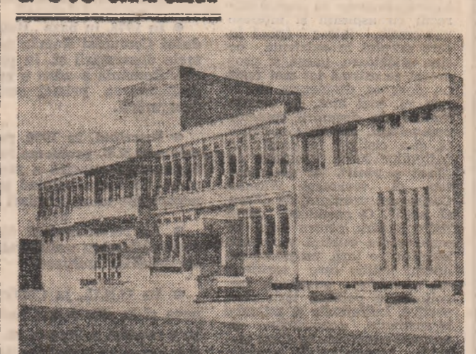
Casa de cultură, a științei și tehnicii pentru tineret din Mădrăgești.