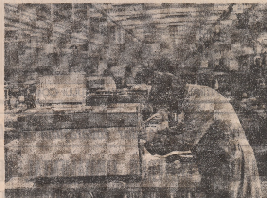
„Electromuzeu”

D.R. Popescu), colectivele dramatice profesioniste din Botoșani („Zăpezile de altădată” de Dumitru Solomon), Brăla („Familia” de Dina Cocea), Sibiu („Frumos e în septembrie la Veneția” de Teodor Mazilu). Un loc distinct în cadrul reprezentațiilor festivalului l-au ocupat spectacolele de teatru scurt, gen ce și-a câștigat o largă audiență în rândul publicului. Astfel, un colectiv al teatrului din Oradea a prezentat piesa „Dula-pul” de Paul Everac, iar teatrul din Arad spectacolul „Vinovatul” de Ion Barbu.