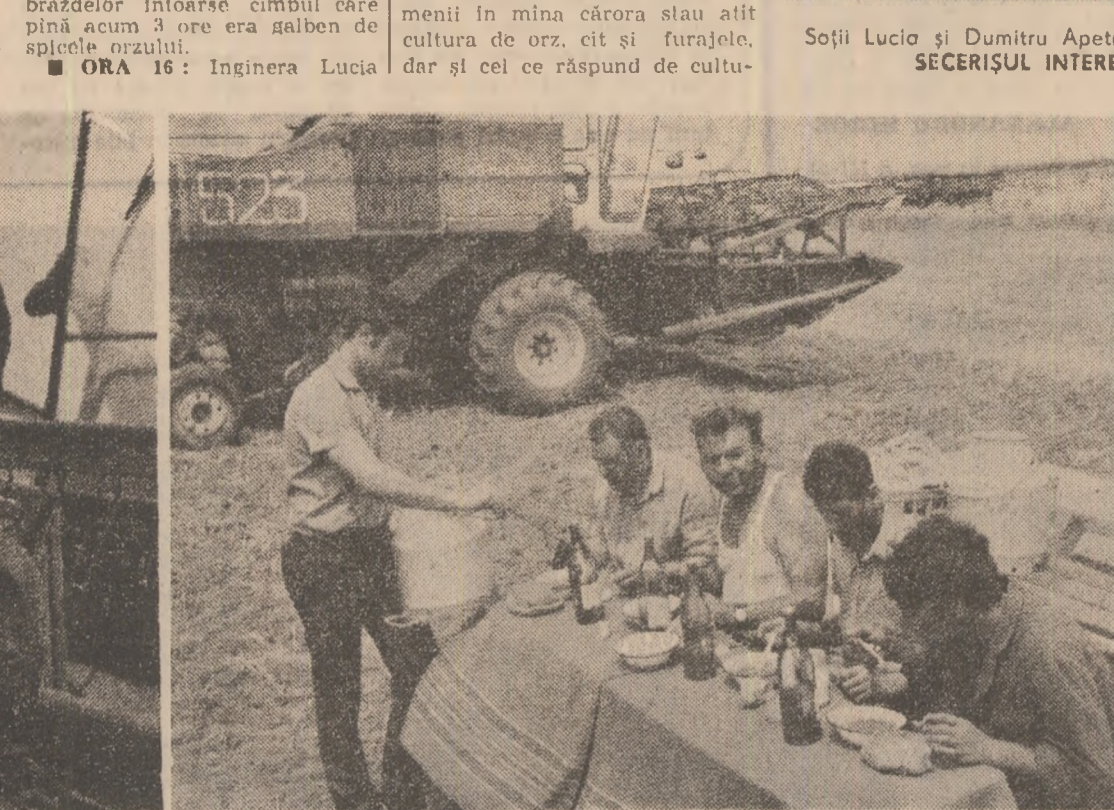
A VENIT MÎNCAREA CALDĂ!

dlitea va scădea și mai mult”. „Vom putea începe și la Ferma 2 Stupina, cred că și la Ferma 3 Sălcia”. Cuvintele sînt rostite spontan, dar oamenii și-ar mînturii lor înșiși gîndurile ce-l frîmțită. Dincolo de ele sîmți concentrate eforturile făcute cu mult înainte, încă din clipa în care aceste lanuri au fost semănate, pentru ca rodul muncii să fie cel așteptat.