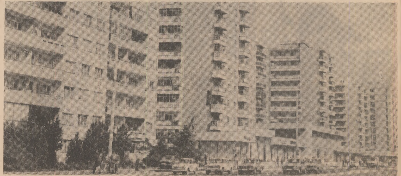
Imagine din Buzău