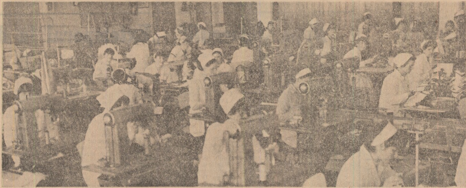
Întreprinderea „Hușana” — județul Vaslui

● Cu remarcabile fapte de muncă au început luna Iulie celelalte de muncitori, ingineri și tehnicieni din cadrul întreprinderii „Laminorul” din Brăila. Ca urmare, în primele zile ale acestui luni, ei au produs 4 000 tone laminat finit, 1 800 tone oțel beton, 40 tone lanțuri și 600 tone oțel calibrat. Concomitent, pe adresa beneficiarilor externi au fost expediate în devans circa 200 tone laminat finit.