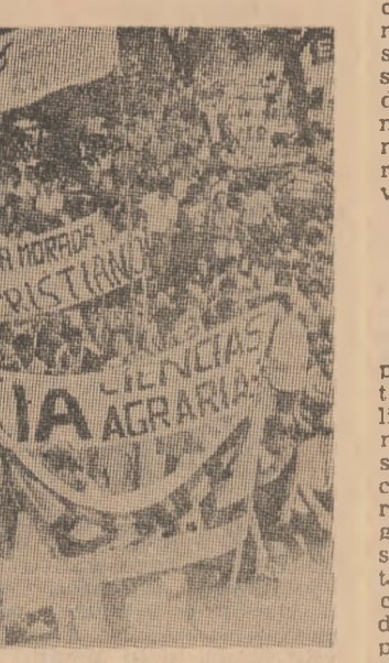
Aspect din timpul unei manifestații a studenților urgențienini în sprijinul democratizării vieții universitare