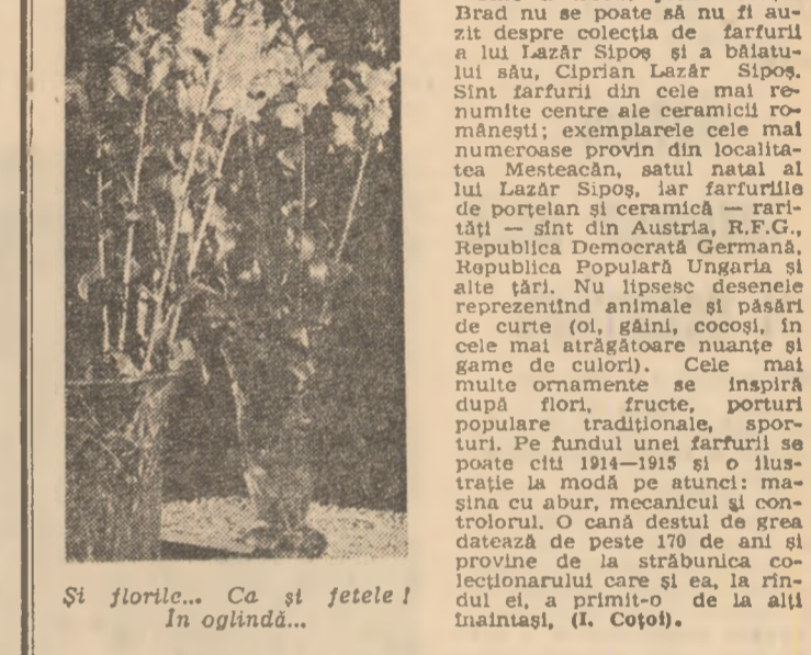
Foto-album COLECȚIE DE RARITĂȚI

Cluj. La Casa de cultură, a științei și tehnicii pentru tineret din Cluj-Napoca are loc expunerea-dezbateri — „Promovarea noului — înaltă îndoire morală și politică a tineretului” de Doj. La Clubul Intreprinderilor de Tractor și Mașini Agricole din Cluj-Napoca se desfășoară simpozionul cu tema : „Formarea conștiinței socialiste a tineretului — sarcină majoră a organizației U.T.C.” Sibiu. 30 000 de tineri din 27 unități economice sibiene și-au propus să realizeze suplimentar, în această săptămîna, o producție în valoare de 23 milioane lei. București. La Întreprinderea de Mașini Grele București 25 de tineri din cadrul secției „meccanici” vor executa lucrări în valoare de 130 000 lei, realizînd subsambele pentru presa 1250 L.f., iar 40 de tineri din cadrul secției „meccano-sudură” vor monta vanele de presiune la rezervoarele de alimentare pentru un grup de 700 Mw, obținînd o producție suplimentară de 150 000 lei.