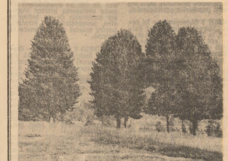
Jos, în vale, se zărește Vatra Dornei!