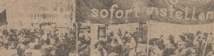
Adunarea solemnă de la Phenian