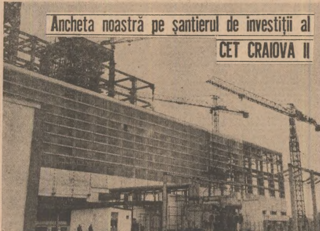
Ancheta noastră pe șantierul de investiții al CET CRAIOVA II