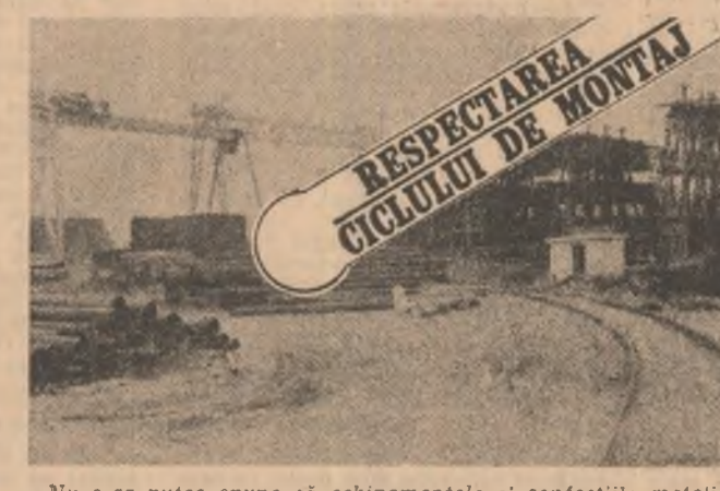
RESPECTAREA CICLULUI DE MONTAJ

Nu, afară nu este frig, este o zi frumoasă de început de toamnă, termometru indică 17 grade Celsius, dar, așa, cu mîinile în buzunare, parcă e mai plăcută plimbarea!