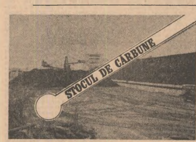
STOCUL DE CĂRBUNE

Stiva de cărbune din prim plan ar trebui — și încă de multă vreme — să o egaleze în dimensiuni pe cea din planul secund. Pentru aceasta, combinatele miniere Motru și Rovinari trebuiau să livreze în plus 150.000 tone cărbune. Sperăm că acest apel — ca și cele legate de asigurarea puterii calorice corespunzătoare, ori de eliminarea din cărbunele livrat a corpurilor străine — să fie recepționate măcar acum cînd, iată, iarna se apropie.