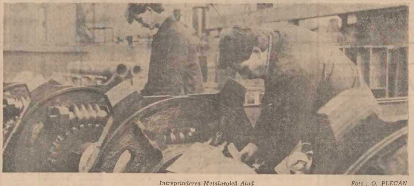
Întreprinderea Metalurgică Aiud

EMIL STANCIU (Continuare în pag. a II-a)