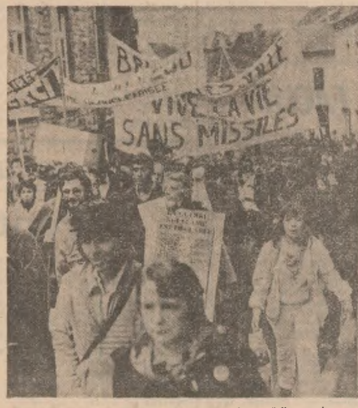
Tineri belgieni se pronunță în favoarea dezarmării nucleare

Într-un interviu acordat cotidianului „Al-Itihad”, care apare la Abu Dhabi, șeful statului sud-yemenit a subliniat necesitatea soluționării conflictului iranian-irakian pe calea negocierilor. Referindu-se la situația pe plan arab, el și-a exprimat încrederea că organizarea unei conferințe internaționale de pace în Orientul Mijlociu va putea contribui la rezolvarea problemei palestiniene, iar a apropiata reuniune extraordinară arabă la nivel înalt, programată să înceapă la 8 noiembrie, la Amman, va duce la eliminarea divergențelor dintre țările arabe, informează agenția China Nouă.