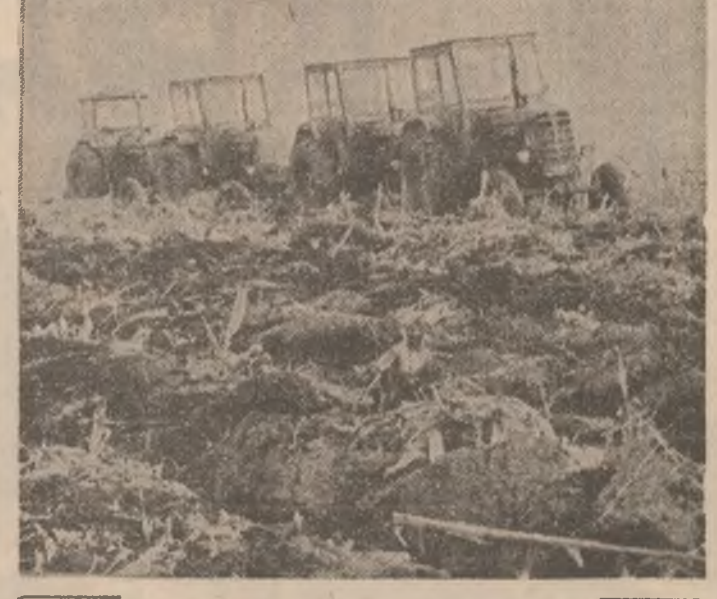
Arăturile care - o lucrare hotărîtoare pentru recoltă anului viitor care - obțin rezultate în condiții de calitate superioară