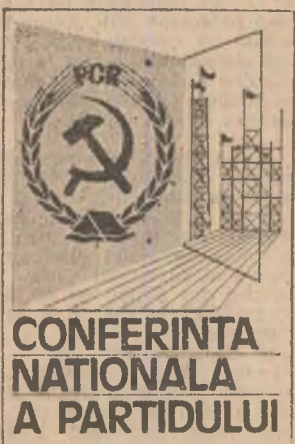
CONFERINȚA NAȚIONALĂ A PARTIDULUI

În amplă activitate internațională a partidului și statului nostru dedicată edificării unei lumi a păcii și colaborării, mai bună și mai dreaptă pentru toate popoarele, acțiunile, propunerile și inițiativele noastre de restructurare radicală, revoluționară a raporturilor internaționale, înfăptuirii unei noi ordini economice și politice mondiale se circumscriu unei orientări programatice, fundamentale, ce decurge din concepția noastră de dezvoltare, științifică a țării noastre.