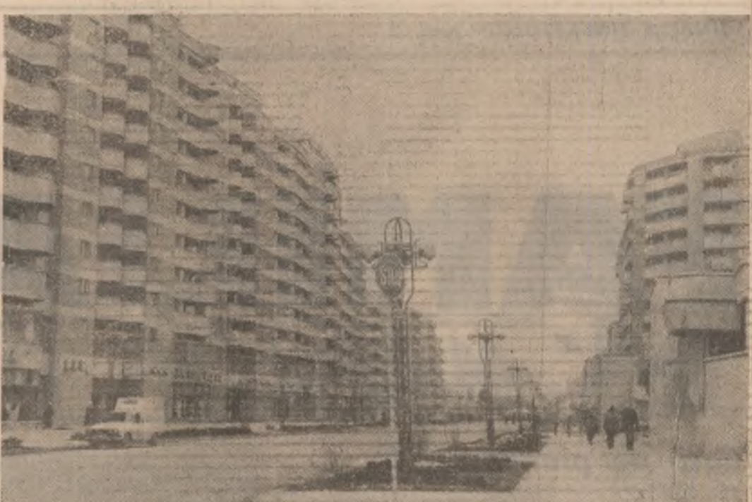
Noi frumuseți arhitecturale ale Bacăului

ANUL XIII SERIA II Nr. 11 931 6 PAGINI 50 BANI LUNI 21 DECEMBRIE 1987