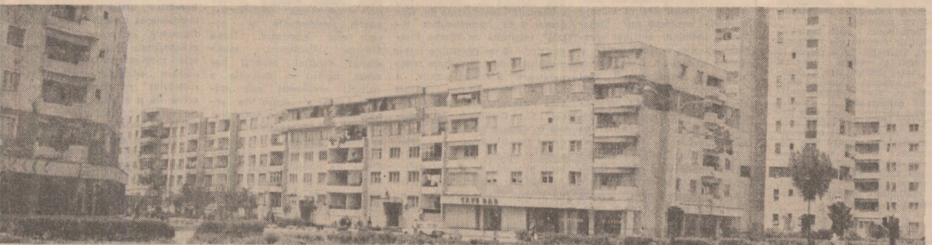
Alexandria — un oraș cu fața spre viitor