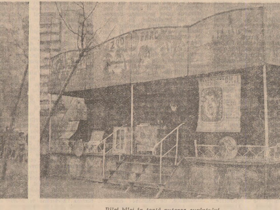
Bilete-bileci în toată puterea cuvîntului