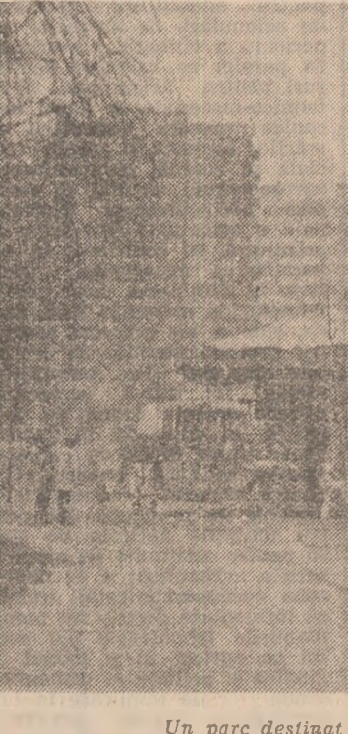
Un parc destinat copiilor, transformat în zoo-parc

Amplasate în perimetrul parcului, pe chiar spațiile verzi, cîteva utilaje, se invit, se invit, se invit, dar nu prea mult căci plata se face la scam și contorul de energie electrică merge. Rulotele vopsite în culorile tradiționale ale circuitului ne induc pentru puțin vreme în eroare: să fi ieșit Circuit de stat cu o parte a lui. Ne dăm seama după lumina ce mîșună pe lângă jocurile mecanice — bagii un leu, dar știți că nu-l mai ai!