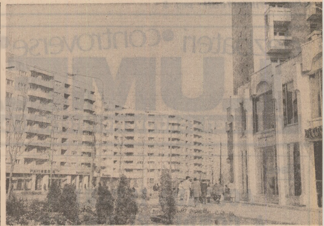
Calea 13 Septembrie — București