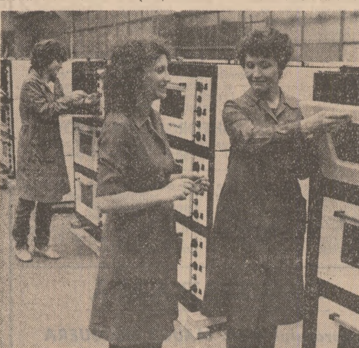
R.P. BULGARIA: Membre ale unei brigăzi de tineret din cadrul fabricii de aparate de uz casnic din orașul Kuustendil, a cărei producție este destinată în cea mai mare parte exportului

De asemenea, s-a anunțat că la 3 februarie va începe cea de-a opta rundă de negocieri între Spania și S.U.A., consacrate încheierii unui nou acord.