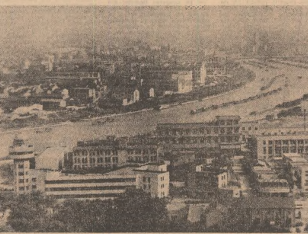
R.P. CHINEZA — Construcții noi în localitatea Wuxi din provincia Jiangu