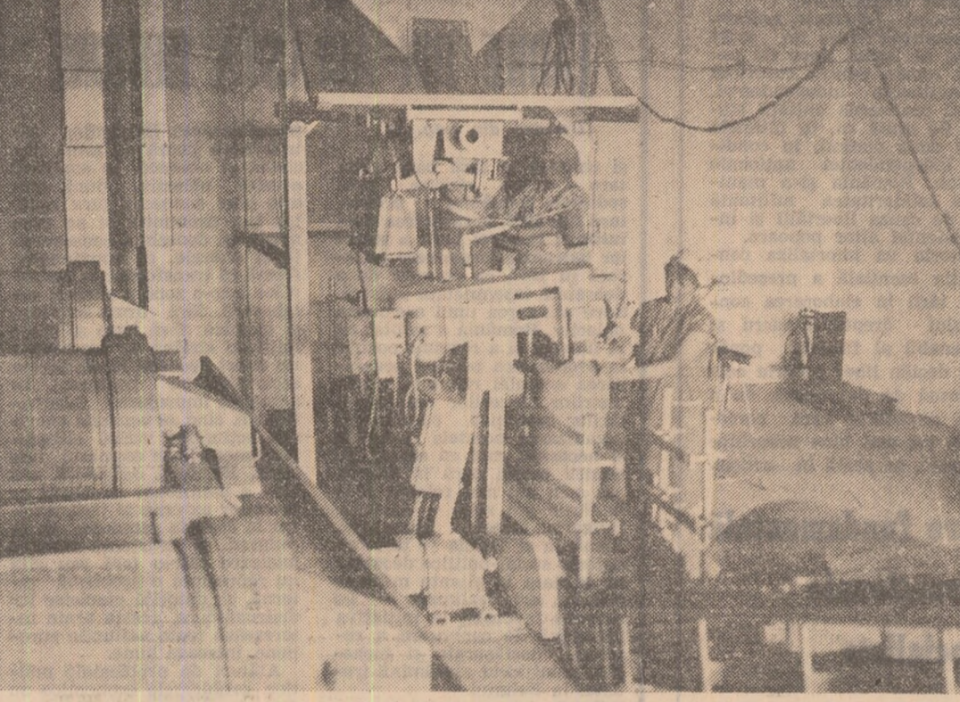
În aceste zile, o acțiune de sezon — pregătirea și expedierea seminței spre unitățile cultivatoare în vederea declanșării operației a lucrărilor din campania agricolă de primăvară.