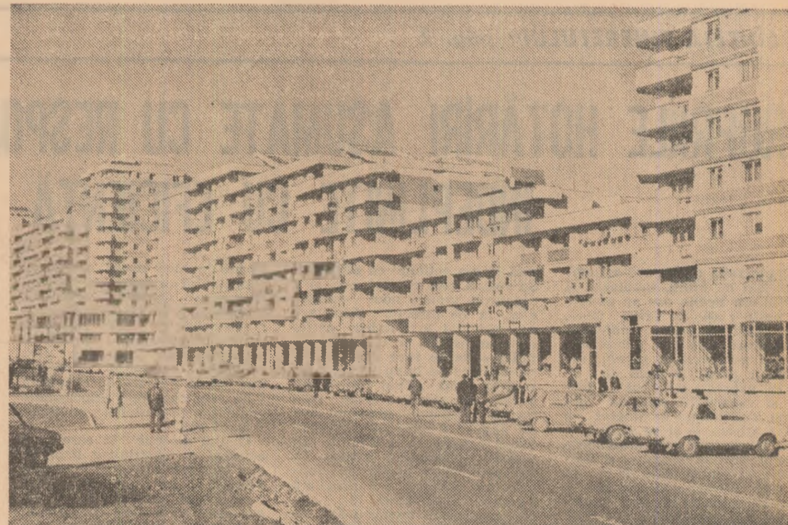
Insemne ale noului in municipiul Pitești

ORGAN AL COMITETULUI CENTRAL AL UNIUNII TINERETULUI COMUNIST