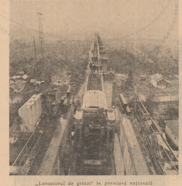
„Lanșatorul de grînzii” în premieră națională.

Ciofrinașii pe mulți dintre cei care au pregătit acest nou marș final: proiectanți, constructori, beneficiari. Fiecare pod este un unicat, atât un lucru știut, principiul rămîne valabil și la viaductul Topolog. El are însă câteva caracteristici care-l vor impune printre cele mai deosebite realizări românești din domeniu. Prin lungime mai întii, fiindcă măsoară 1.350 de metri, dar și prin înălțimea la care se află (peste 50 de metri), prin folosirea grinzilor de beton în loc de tabierele metalice, noul pod s-a înscris deja în galeria marilor construcții feroviare din țara noastră. Prima discuție cu constructorii este de așezare pentru reporter: n-a fost nimic deosebit, a mers bine și cînd totul merge bine ai mai puțin de reținut și de pomenit. Inceit, înscrit înă, discuția se urmește pentru că efectiv realizarea are grandioare, nu s-a făcut fără o istorie interesantă. Tehnologiile în premieră au fost folosite încă de la etapa infrastructurii în care, de exemplu, caracterul de puternică instabilitate a Subcarpaților noștri s-a resimțit din plin și în această zonă. Pe unul dintre maluri a trebuit stabilizat un plan de alunecare, așezat la fost mari infiltrații. Trei moda-