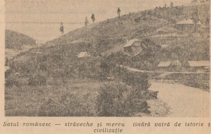
Satul românesc — străvechi și mereu tinăra vatră de istorie și civilizație