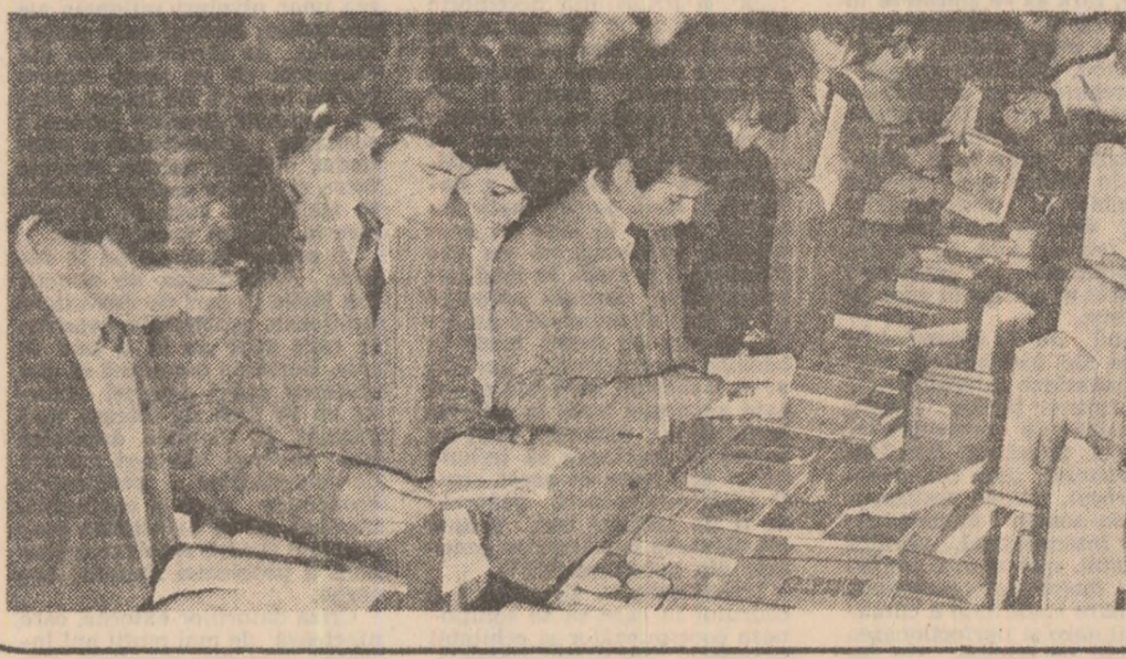
Salonul cărții pentru tineret, organizat de Uniunea Tinerilor din România.