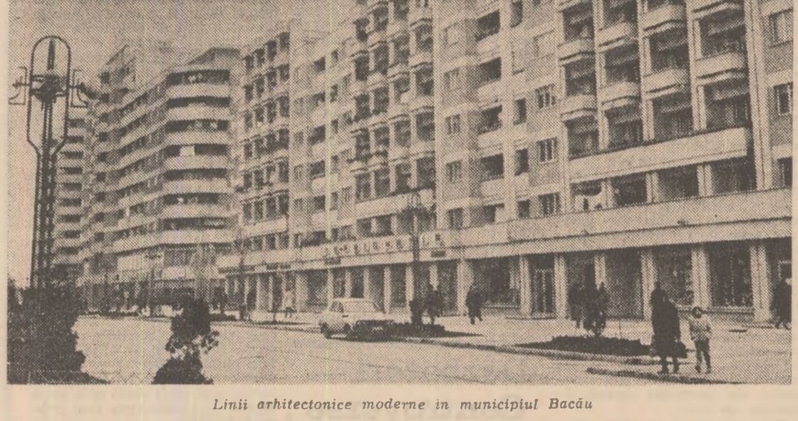
Linii arhitectonice moderne în municipiul Bacău