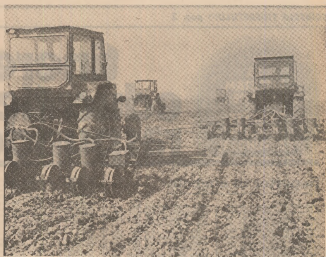
Campania agricolă de primăvară

CĂTĂLIN BORDEIANU (Continuare în pag. a III-a)