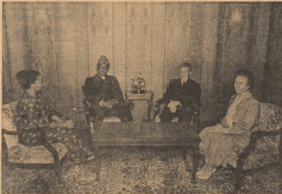
În acest context, s-a relevat necesitatea de a se acționa în continuare pentru realizarea în bune condiții a acordurilor, a tuturor proiectelor de colaborare existente între România și Zair, subliniindu-se rolul important ce revine comisiei mixte guvernamentale în extinderea, în forme moderne și pe baze reciproc avantajoase, a colaborării bilaterale, a cooperării la producție pe baze stabile și de lungă durată, precum și pentru diversificarea schimburilor comerciale, potrivit cerințelor și programelor de dezvoltare economică-socială ale celor două țări.

În cursul dimineții de marți au continuat, la Palatul Consiliului de Stat, convorbirile oficiale între tovarășul Nicolae Ceaușescu, secretar general al Partidului Comunist Român, președintele Republicii Socialiste România, și președintele fondator al Mișcării Populare a Revoluției, președintele Republicii Zair, Mobutu Sese Seko. Au fost examinate noi căi de promovare a colaborării dintre cele două țări, în special a cooperării economice, schimbul de vederi, evidențind posibilitățile largi de amplificare și adâncire a conlucrării româno-zaireze în diferite domenii de interes comun.