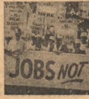
O reducere, fie și cu 1 la sută, a cheltuielilor militare și transferarea acestor sume către domeniul economic-social...