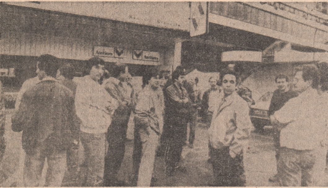
Tineri șomeri francezi protestind împotriva unei noi reduceri a locurilor de muncă

ROMA 7 (Agerpres) — Ministrul Afacerilor Externe al Italiei, Ciriaco De Mita, a anunțat pentru o mai activă participare a țărilor din C.E.E. la procesul general de pace și dezvoltare, la rezolvarea conflictelor regionale. De asemenea, a anunțat că va susține implicativ pe care le are în imensa datorie externă a țărilor în curs de dezvoltare asupra economiilor din statele industrializate, informează agenția ANSA. Acastă poziție a ministrului italian de externe a fost exprimată în cadrul lucrărilor unei reuniuni a Federației partidelor democrat-cristine din țăările Pieței Comune, desfășurată la Palermo.