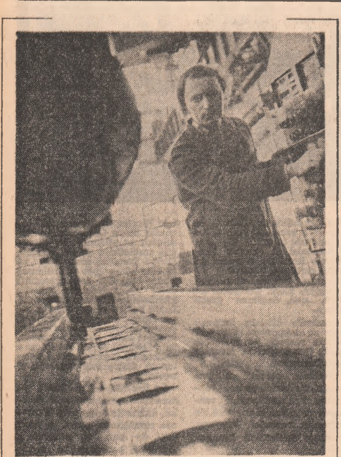
Tehnică modernă — o prezență cotidiană la Întreprinderea de Mașini Unelte Arad