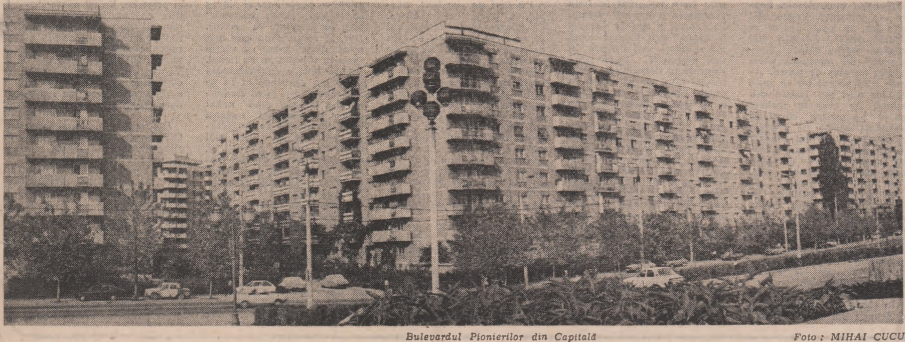
Bulevardul Pionierilor din Capitală