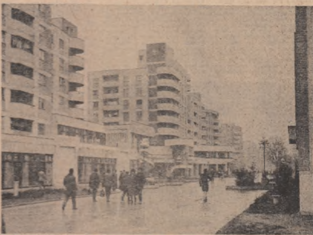
Noul centru civic al municipiului Alexandria