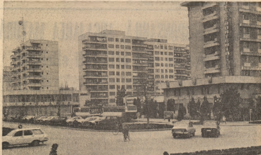
Municipiul Sîrbia, județul Iași