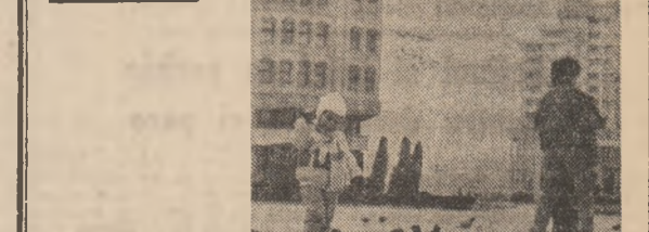
Copiii și porumbelii sunt întotdeauna prieteni!